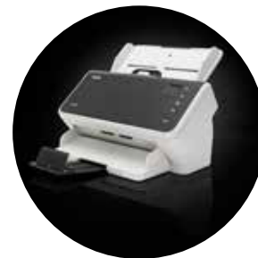
Alaris S2050/S2070 掃描器