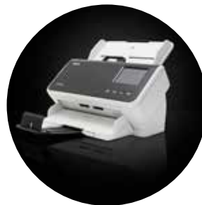
Alaris S2060w/S2080w 掃描器