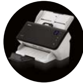
Alaris E1025 和 E1035 扫描仪

* 吞吐速度可能会视您选择的应用程序软件、操作系统、PC 和选择的影像处理功能而异。